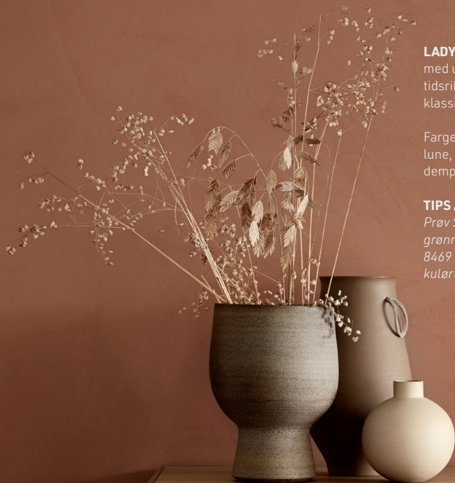
VEGG: LADY MINERALS REVIVE 20046 SAVANNA SUNSET

Prøv Savanna Sunset sammen med frodige grønn-toner som 8252 Green Harmony , eller 8469 Green Leaf dersom du ønsker en mer kulørt palett.