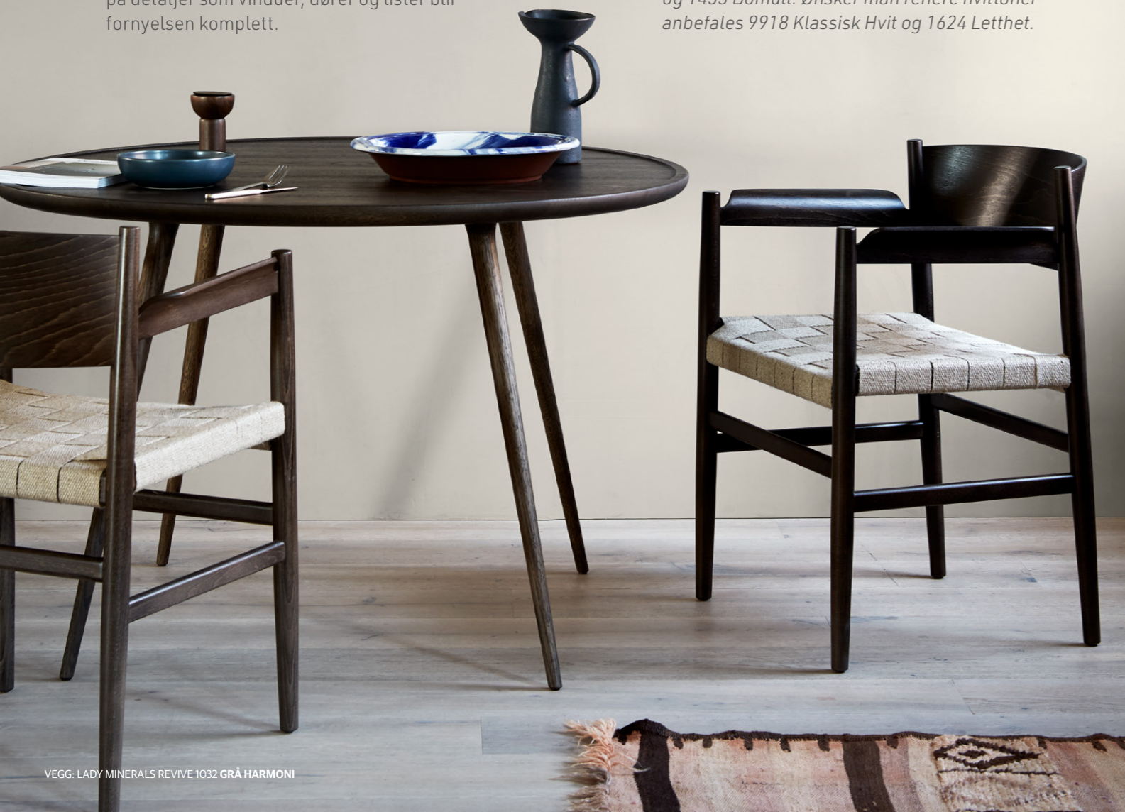
VEGG: LADY MINERALS REVIVE 1032 GRÅ HARMONI

1032 Grå Harmoni og 1877 Valmuefrø er vakre mot gylne hvittoner som 1001 Egghvit og 1453 Bomull. Ønsker man renere hvittoner anbefales 9918 Klassisk Hvit og 1624 Letthet.