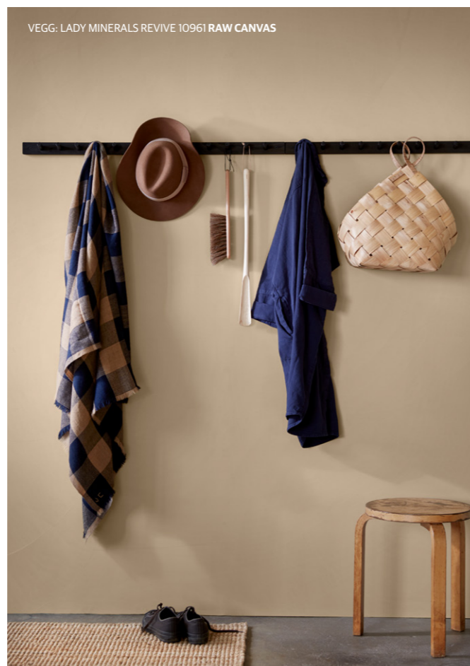
VEGG: LADY MINERALS REVIVE 10961 RAW CANVAS