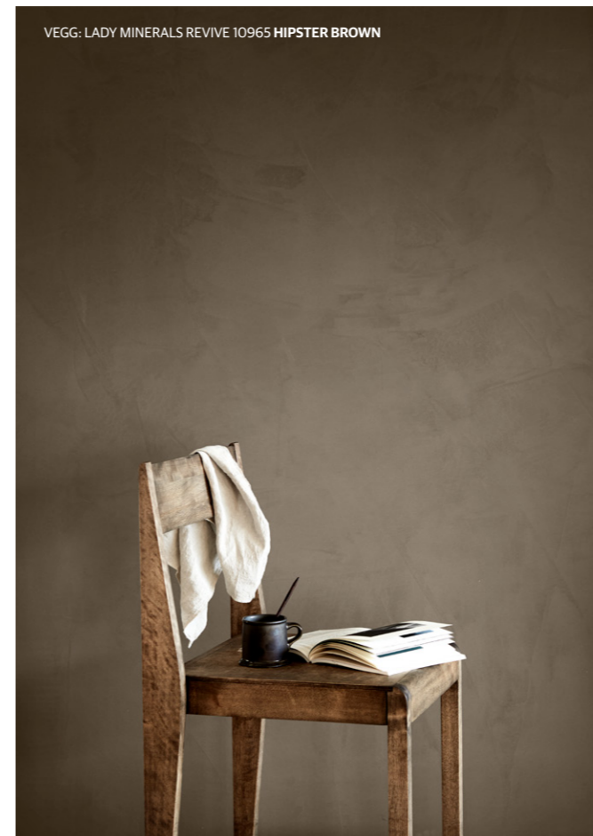
VEGG: LADY MINERALS REVIVE 10965 HIPSTER BROWN