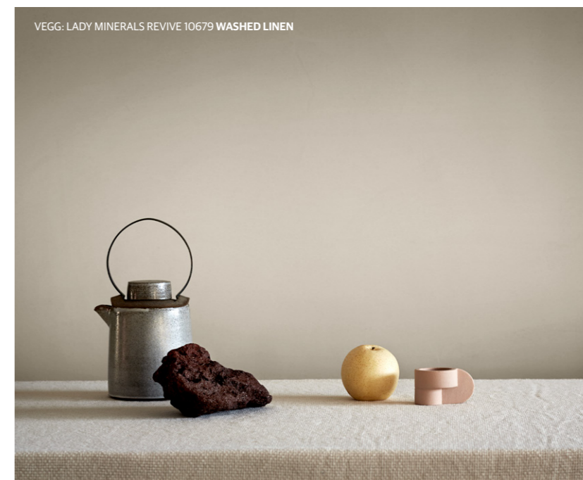
VEGG: LADY MINERALS REVIVE 10679 WASHED LINEN

TIDSRIKTIG FORNYELSE LADY Minerals Revive forvandler ujevne underlag til vakre betongaktige vegger.