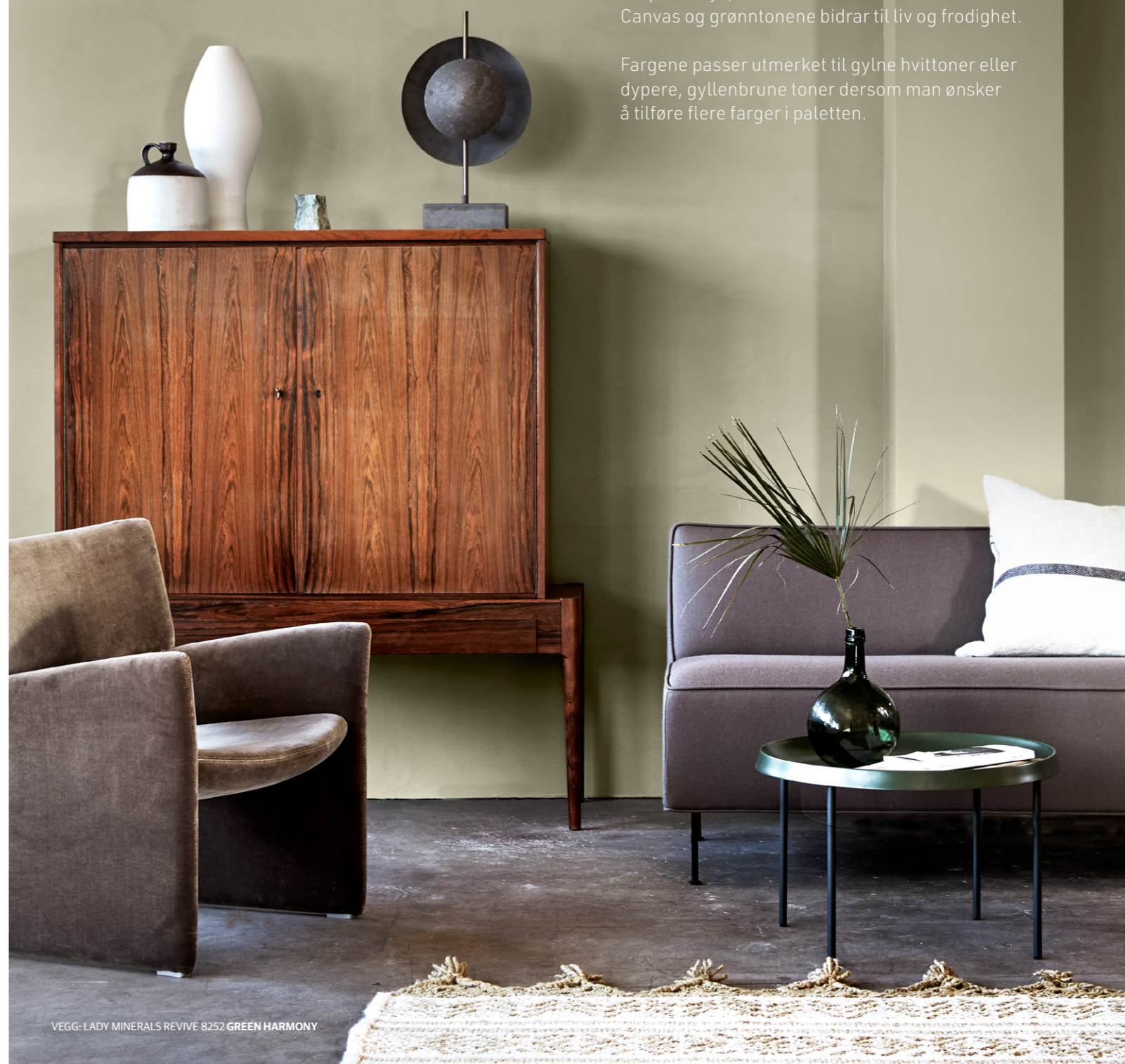
VEGG: LADY MINERALS REVIVE 8252 GREEN HARMONY

Fargene passer utmerket til gylne hvittoner eller dypere, gyllenbrune toner dersom man ønsker å tilføre flere farger i paletten.