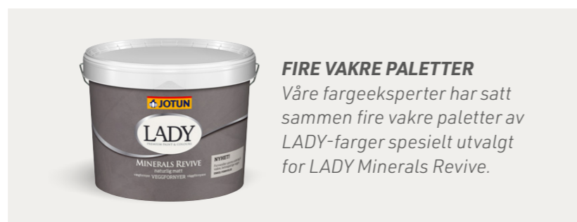
VEGG: LADY MINERALS REVIVE 8469 GREEN LEAF