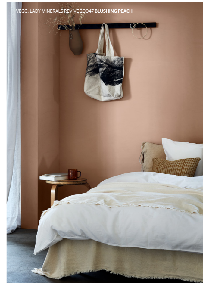
VEGG: LADY MINERALS REVIVE 20047 BLUSHING PEACH