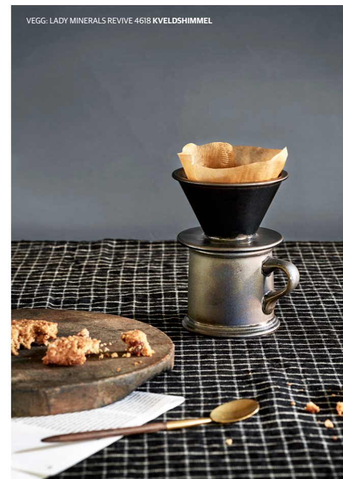
VEGG: LADY MINERALS REVIVE 4618 KVELDSHIMMEL