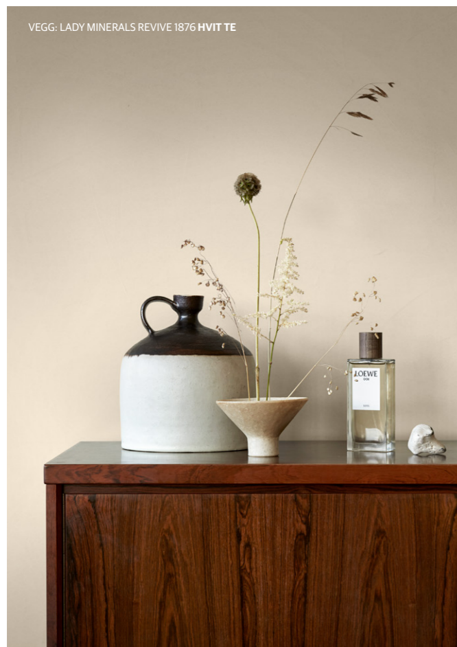
VEGG: LADY MINERALS REVIVE 1876 HVIT TE