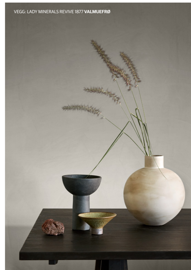
VEGG: LADY MINERALS REVIVE 1877 VALMUEFRØ